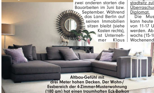
Altbau-Gefühl mit drei Meter hohen Decken. Der Wohn-/Essbereich der 4-Zimmer-Musterwohnung (180 qm) hat einen traumhaften Eck-Balkon