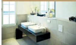
Das größere der beiden Bäder, zudem gibt's ein Gäste-WC