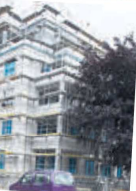
Villa 4 im Diplomatentpark soll schon im November bezogen werden